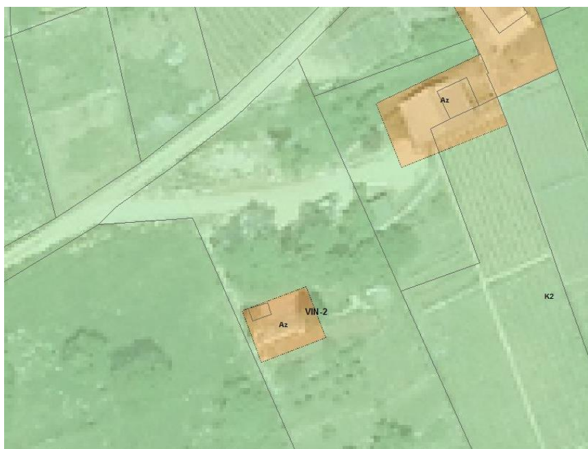
Slika 5: Prikaz popravka – spremenjene lege območja Az