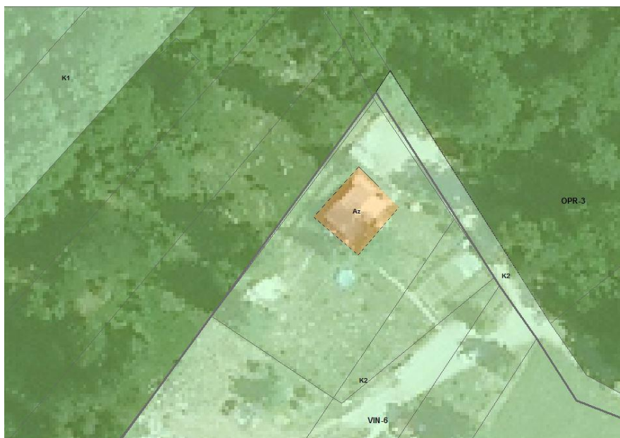
Slika 3: Prikaz popravka – spremenjene lege območja Az