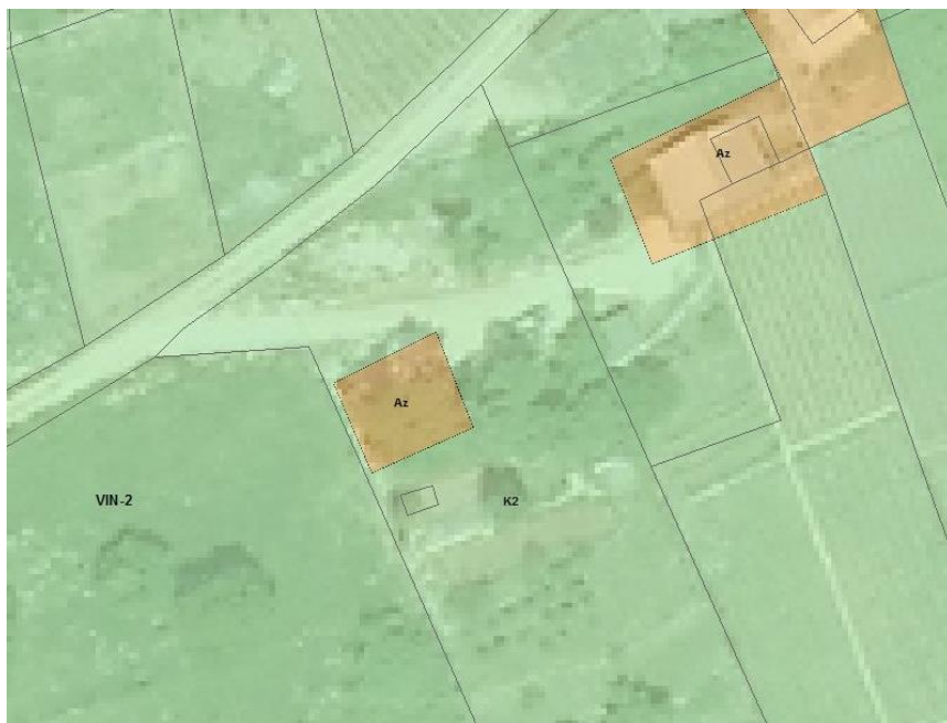
Slika 4: Prikaz lege območja Az v veljavnem OPN Straža

Gre za očitno neskladje v grafičnih podlogah, ki se odpravi tako, da se območje z namensko rabo Az na parceli št. 1168/1 k. o. Prečna premakne nekoliko bolj južno na dejansko lokacijo objekta , kot je razvidna iz letalskega posnetka in podatka o katastru stavb.