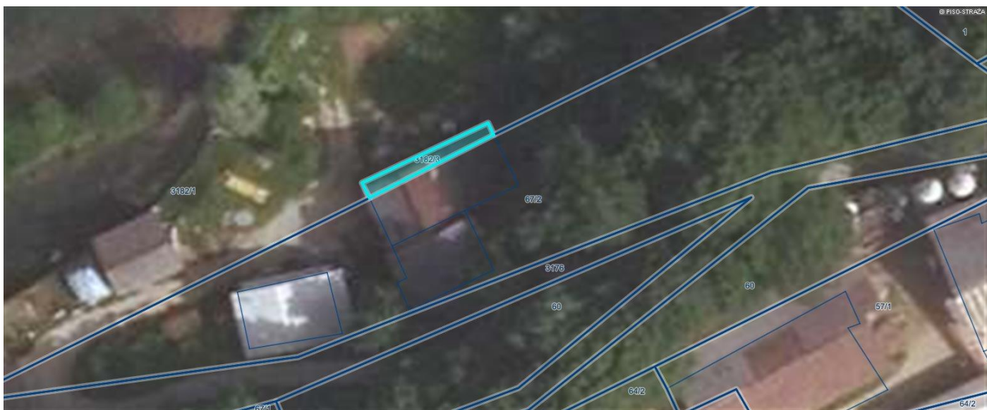
Sl.2 Razpolaganje s parcelami k.o. Jurka vas 3182/3 vloga za odkup