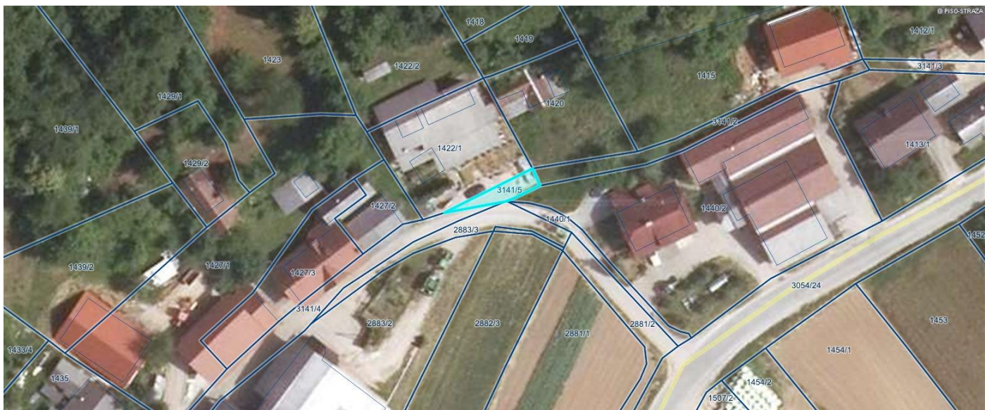
Sl.1 Razpolaganje s parcelami k.o. Prečna, 3141/5, vloga za odkup